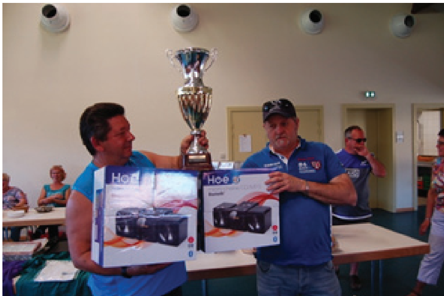
Les vainqueurs du concours de boules

Il a donné rendez vous l'année prochaine, toujours début mai, pour ce concours.