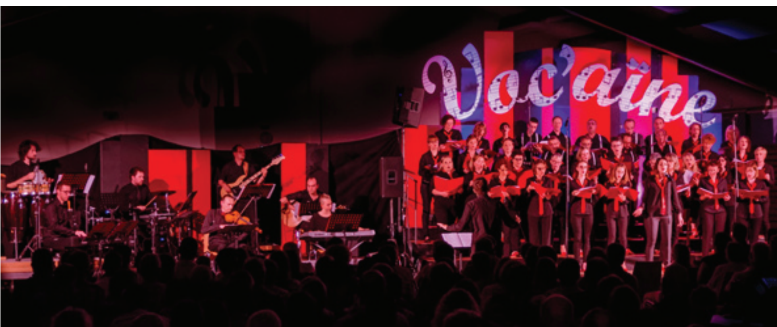
Les musiciens et les choristes de Voc'aïne

Les prochains concerts sont prévus les 7 et 8 décembre à 20 h et le 9 décembre à 17h dans la chapelle de l'ancienne abbaye à Ergersheim.