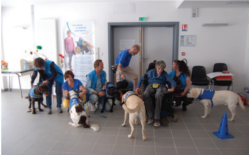
Les familles d'accueil après les diverses démonstrations

La démonstration de dressage des chiens pour handicapés a rencontré un vif succès. En effet, près d'une cinquantaine de personnes se sont déplacées pour assister aux divers exercices proposés par les familles d'accueil de ces jeunes chiens.